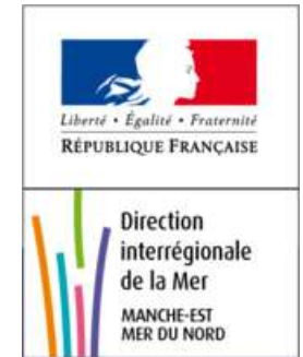
la Direction Interrégionale de la Mer