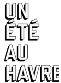
Le GIP Un Été Au Havre